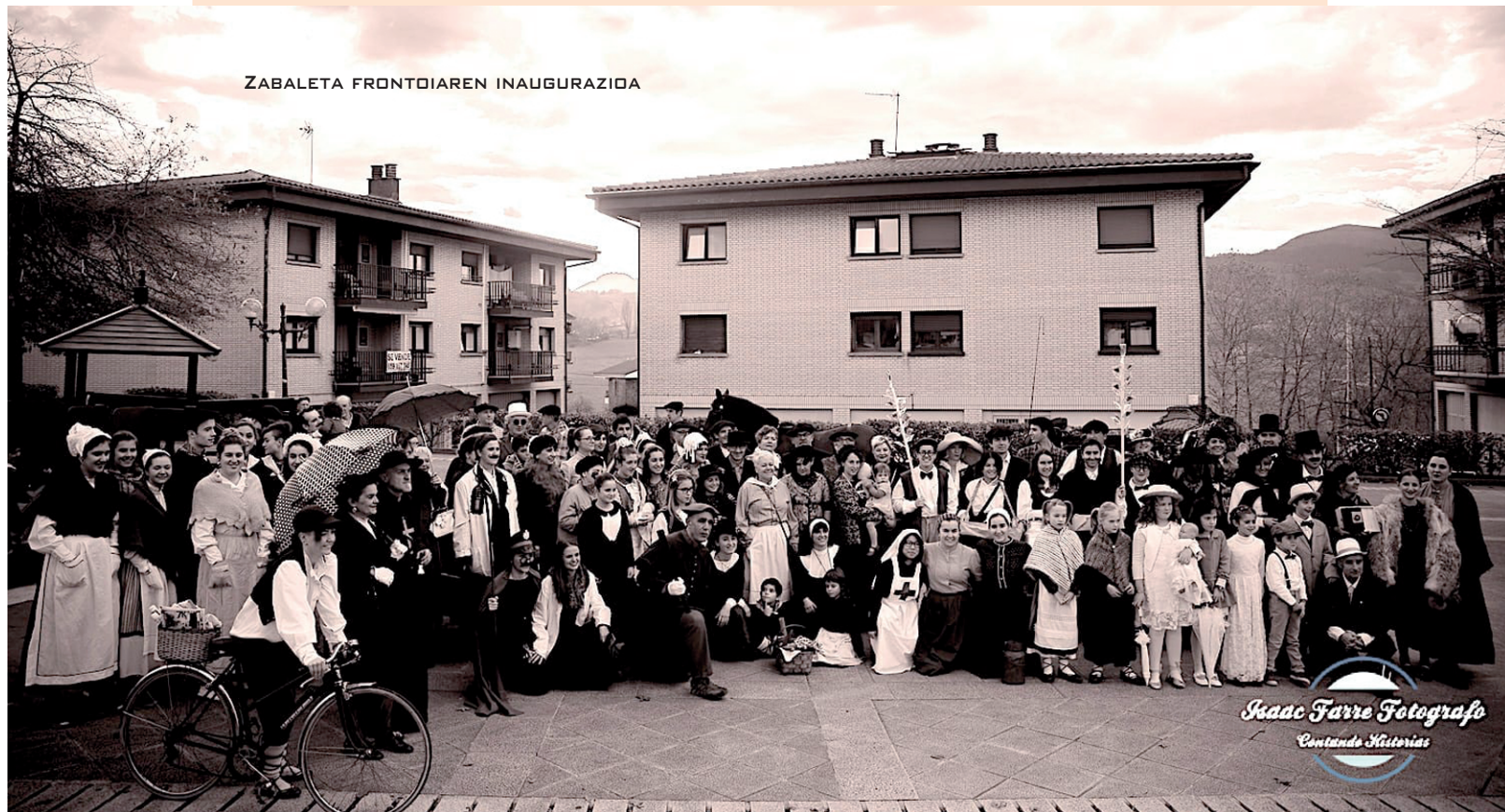
ZABALETA FRONTOIAREN INAUGURAZIOA

Aldaketek eta gora beherek bihotza mugiarazten digute, poliki, korrika edo saltoka.