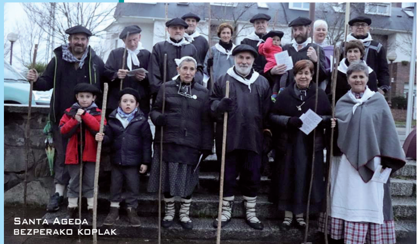
SANTA AGEDA BEZPERAKO KOPLAK