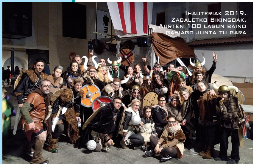
IHAUTERIAK 2019. ZABALETKO BIKINGOAK. AURTEN 100 LAGUN BAINO GAHJAGO JUNTA TU GARA