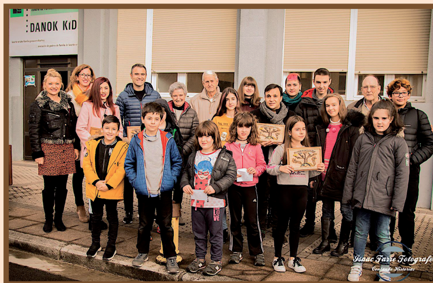
FOTO DE FAMILIA CON CONCURSANTES Y ORGANIZADORES, TRAS LA ENTREGA DE PREMIOS DEL XXVI CONCURSO DE BELES (2018) DE DANOK KIDE

El informe de la edición 2017 terminaba con este comentario: "de momento, planificaremos el curso 2017/2018, luego ya veremos. Son 55 años de dedicación, de trabajar con mayor o menor fortuna en beneficio de nuestro pueblo, después... vosotros, la población de Lasarte-Oria, tenéis la palabra".