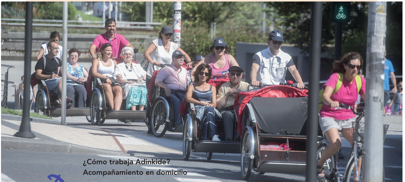
¿Cómo trabaja Adinkide? Acompañamiento en domicilio

Trabajamos con un enfoque global y transversal, involucrando a toda la sociedad. La soledad, factor de riesgo para la salud y considerada ya "problema de salud pública" por muchos expertos y autoridades, es un fenómeno que nos afecta a todos.